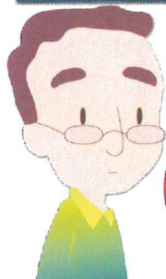
聴覚に障がいを持つ方